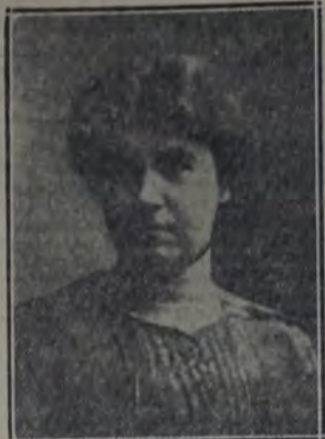
DOCTORA ALICIA MOREAU DE JUSTO

tituir el actual sistema de comercio, suprimiendo los intermediarios inútiles. Enseñando al pueblo a ser el director económico de su propio esfuerzo creador. 2o. Porque es un movimiento inspirado por una profunda simpatía humana que lo hace asociarse a las