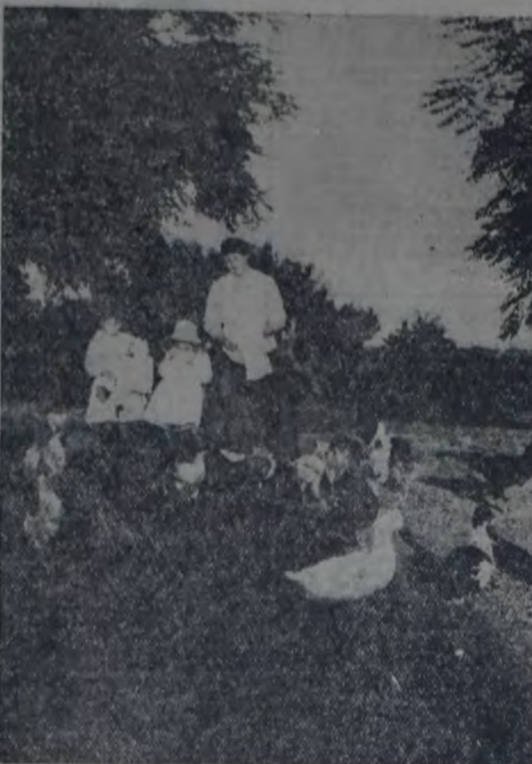
CHACRA DE PROPIETARIO.

¿Cuándo ofrecerán todas las chacras argentinas este seductor aspecto de belleza, de tranquilidad y de abundancia?