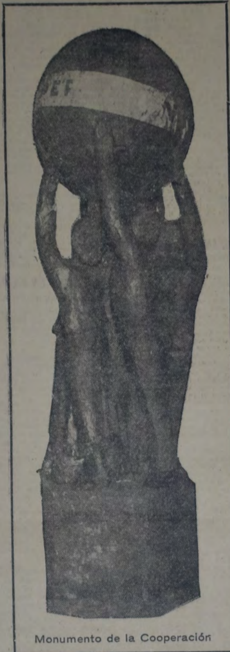
Monumento de la Cooperación